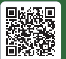
ဒီလီၤ QR အခိး(တ)နီၢ်ဂံၢ်လၢတၢ်ဂ့ၢ်တၢ်ကျိၤဆူညါအဂီၢ်တက့ၢ်

Amputation Your-amputation-journey.pdf (health.wa.gov.au)